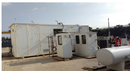
Bilden visar reformern till det 50 kW kraftvärmesystem som ingick i AutoRE-systemet i Rugby, England.

Ett viktigt tillämpningsområde för Metacons vätgasgeneratorer är att tillverka system med bränsleceller för produktion av el i större skala än vad som åstadkoms i H 2 PS-5. Helbio har varit en av delsystemleverantörerna i EU projektet AutoRE (Automotive derivative energy systems). Projektet var en del av EUs ramprogram Horizon 2020, med syftet att skapa basen för en kommersialisering av bränslecellssystem framtagna av fordonsindustrin för andra applikationer än fordon.