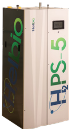
Bilden ovan visar ett H 2 PS-5-system

I många länder finns stort intresse för miljövänliga kraftvärmesystem (CHP) för bostäder, mindre byggnader och företag, samt elkraftsystem (APU=Auxiliary Power Unit) för byar och många öar runt om i världen som idag får sin el från dieselgeneratorer, tillfälliga anläggningar som fältsjukhus, flyktingläger mm i strömlösa områden. CHP-enheterna kan ersätta dagens oljepannor och vedpannor och de producerar dessutom elektricitet. Speciellt finns behov i länder med elbrist, eller med tillgång till billig naturgas, och i bl.a. Tyskland och Japan subventioneras sådana mindre kraftvärmesystem för privatpersoner av staten.