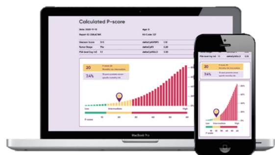
Illustration av Prostatype Genomics programvara som visar hur P-score beräknas och presenteras.

Genom att använda AI-teknik har Bolaget skapat flera algoritmer. Programvaran används för att räkna ut ett P-score, vilket är ett mått på hur aggressiv (eller icke-aggressiv) cancer är, vilket underlättar valet av optimal behandlingsstrategi för patienten. Prostatype® hjälper därmed till att säkerställa livskvaliteten för patienter med en lågrisktumör, utan att äventyra säkerheten för patienter med aggressiva tumörer.